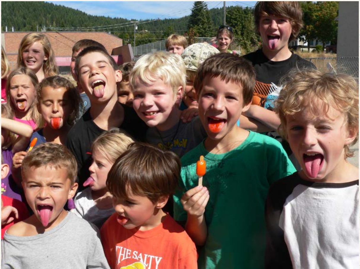
Des langes de couleurs d'arc-en-ciel!

Le vendredi 14 septembre, les élèves ont participé à la course Terry Fox organisée par l'école. Ils ont suivi le parcours et, après chaque tour, ils recevaient une étampe sur leur carte qui servait à tenir compte du nombre de circuits qu'ils avaient accomplis. Après, il y avait une petite collation gelée pour tous.