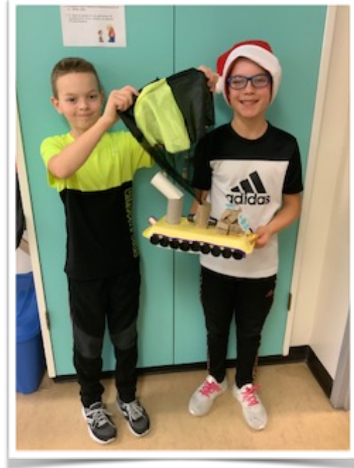
Fabrication d'un engin spatial - 6e année